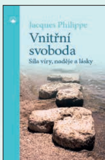
VNITŘNÍ SVOBODA Jacques Philippe Brož., 136 str., 169Kč