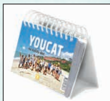
YOUCAT NA KAŽDÝ DEN Vazba twin, 384 str., 289Kč