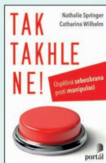
TAK TAKHLE NE! Nathalie Springer, Catharina Wilhelm Brož., 216 str., 349Kč