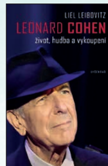
LEONARD COHEN – ŽIVOT, HUDBA A VYKOUPENÍ Liel Leibovitz Váz., 216 str., 297Kč