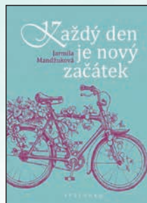
KAŽDÝ DEN JE NOVÝ ZAČÁTEK Jarmila Mandžuková Váz., 128 str., 195Kč