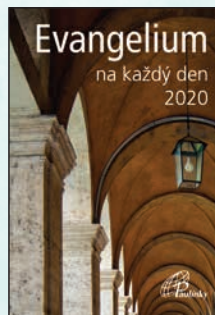
EVANGELIUM NA KAŽDÝ DEN 2020 Brož., 488 str., 109Kč