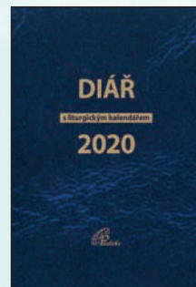
VELKÝ DIÁŘ NA ROK 2020 S LITURGICKÝM KALENDÁŘEM Váz., 392 str., 200Kč