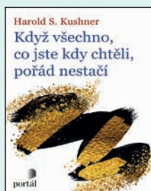
KDYŽ VŠECHNO, CO JSTE KDY CHTĚLI, POŘÁD NESTAČÍ Harold S. Kushner Brož., 176 str., 249Kč