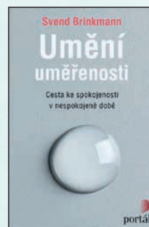
UMĚNÍ UMĚŘENOSTI Svend Brinkmann Brož., 120 str., 225Kč