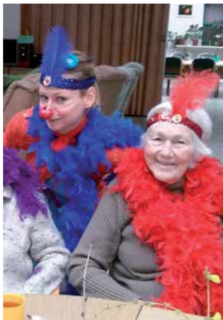
Varieté ve stacionáři.