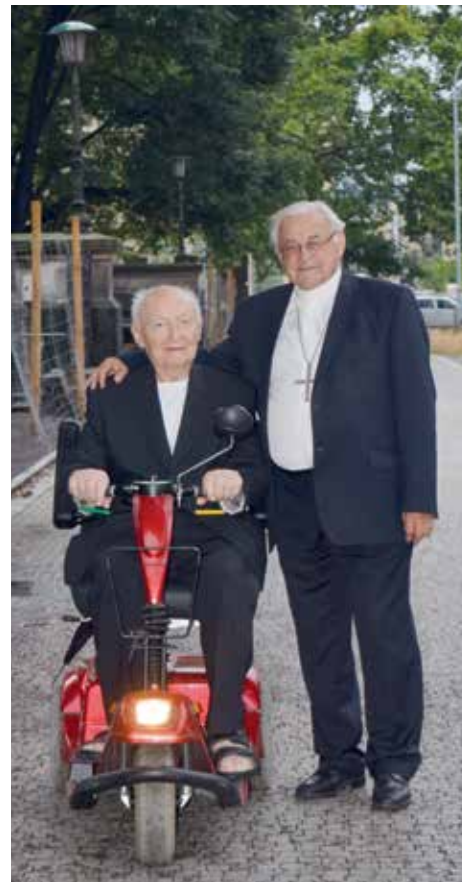
P. Bohumil Kolář a kardinál Miloslav Vlk.

Cesta 121 vznikla před osmi lety a vytkla si za cíl pomáhat kněžím. Původním záměrem bylo poskytovat péči starším osobám a být určitou alternativou kněžským domovům. Měla sloužit k tomu, aby mohl být kněz i na stará kolena v domácím prostředí a těšit se ze společenství přátel a lidí, kteří ho mají rádi. Postupem času se služby Cesty 121 rozšiřovaly a ukázalo se, že pomocnou ruku v různých situacích ocení i mladší kněží.