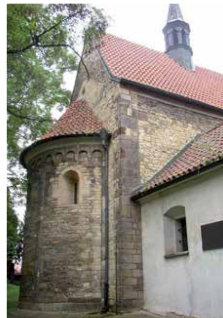
Dolní Chabry.