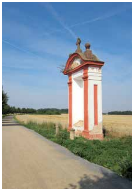
Poutní cesta do Hájku.