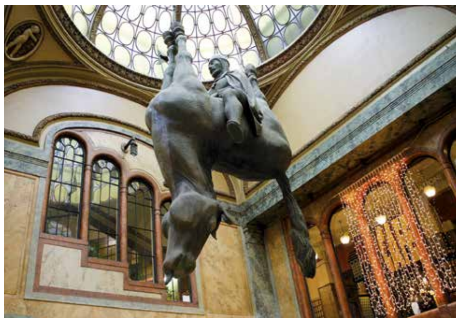
David Černý: Kůň