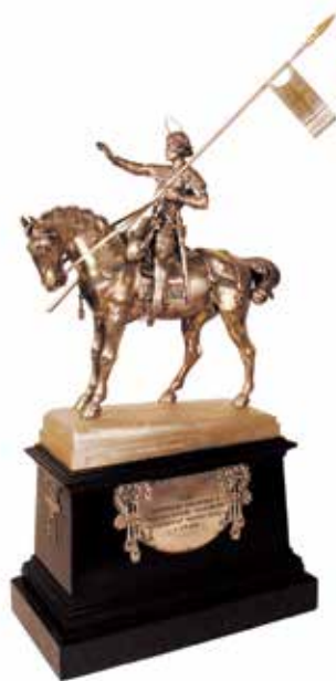
Bohuslav Schnirch (návrh): Miniatura pomníku sv. Václava

Takové námitky zaznívaly již v meziválečné době. Mluví o tom Šalda ve svém článku „Mor pomníkový“. Ale znovu se