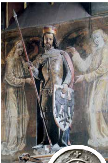
Petr Parlér: Socha sv. Václava