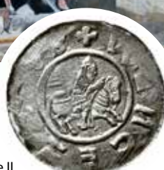
Denár knížete Bořivoje II.

na Zlaté bráně, mezi bustami českých patronů na vnější části svatovítského triforia, na rámu Madony svatovítské (kol. 1400, Národní galerie v Praze) a na rámu Svatovítského veraikonu (kol. 1400, Národní galerie v Praze).