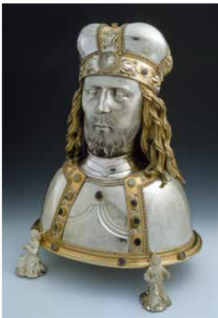
Relikviářová busta sv. Václava

Velkým ctitelem sv. Václava byl císař a král Karel IV. Učinil ho na věčné časy vlastníkem české královské koruny. Panovník si ke státoprávním úkonům korunu od sv. Václava pouze vypůjčoval a platil za to kapitule svatovítské. Karel IV., jenž po matce pocházel z „rodiny sv. Václava“, nechal v nově založené Svatovítské katedrále zřídit nádhernou kapli sv. Václava. Hrob světcův byl ozdoben zlatými reliéfy s postavou sv. Václava adorovaného Karlem IV. a jeho ženou a dále s martyrii českých zemských patronů. Na výstupku tumbly byla umístěna zlatá relikviářová busta s lebkou sv. Václava. Na ní měla spočívat královská koruna. Kapli sv. Václava dominuje nádherná socha světce vytvořená v roce 1372 Jindřichem Parlěm. Vyobrazení sv. Václava ve sboru českých zemských patronů nalezneme také na dalších památkách v katedrále sv. Víta, sv. Václava a sv. Vojtěcha, které nechal pořídit Karel IV. či pražští arcibiskupové v jeho době. Postavu světce spatřujeme na mozaice